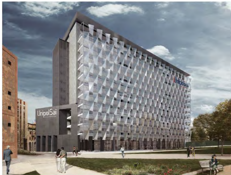
Vista Sud da parco - Stato di Progetto