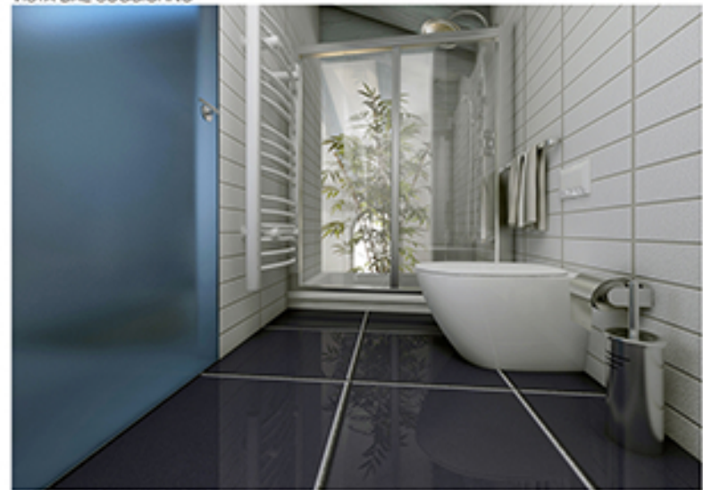
VISTA INTERNA AL BAGNO