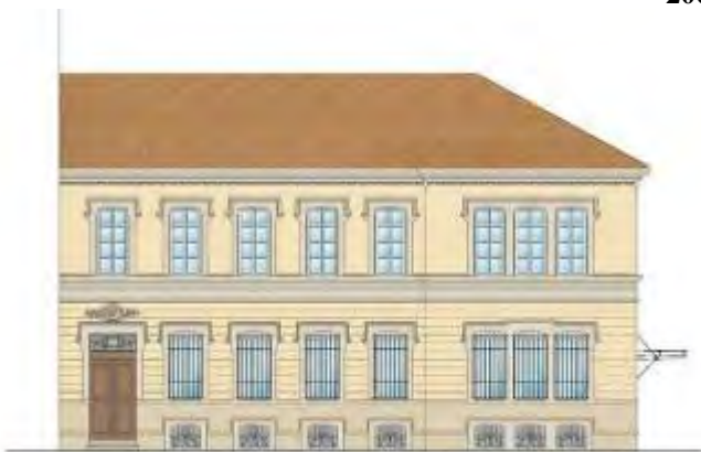
PROSPETTO SU VIA IGNAZIO GIULIO