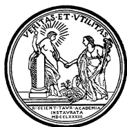
ACCADEMIA DELLE SCIENZE DI TORINO

L'Accademia delle Scienze di Torino, dove di particolare rilevanza sono la conservazione dell'importante patrimonio librario storico unito all'elevato carico d'incendio ed alle necessità derivanti dalla presenza di pubblico, in particolare nella monumentale Sala dei Mappamondi. (dal 2017, in corso)