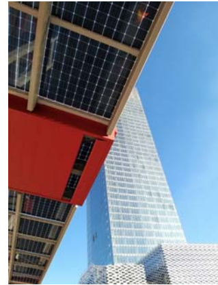
PALAZZO REGIONE PIEMONTE E PROMENADE