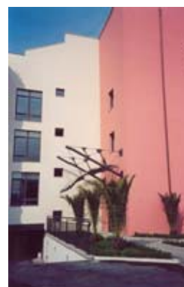
NAPOLI, GEOMARE SUD

Progetto architettonico definitivo ed esecutivo Collaborazione alla direzione lavori per la parte architettonica