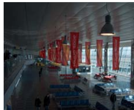
TORINO, AEROPORTO CASELLE

Coordinamento Tecnico Generale dei Consulenti per la Progettazione preliminare