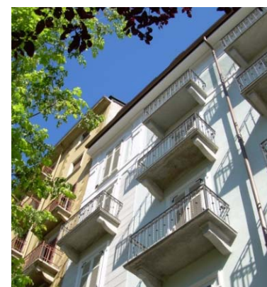
TORINO, RISTRUTTURAZIONE IN CORSO DE GASPERI