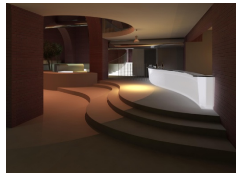
TORINO, LOCALE AI MURAZZI