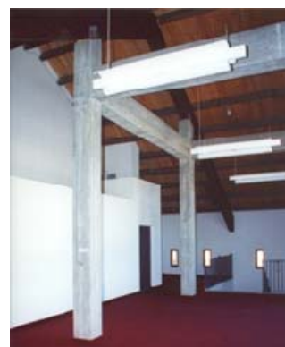
CANTALUPA, STRUTTURA POLIVALENTE

Progetto architettonico esecutivo Collaborazione alla direzione lavori