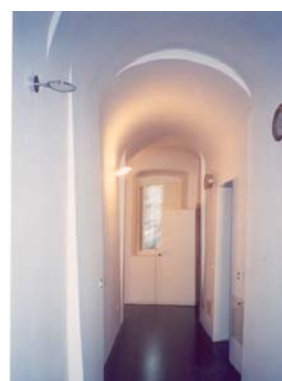
CASTELLO DI RIVOLI, CENTRO EDUCATIVO

Progetto opere di consolidamento strutturale Collaborazione alla direzione lavori