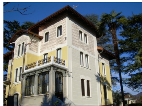
RISTRUTTURAZIONE IN CUMIANA