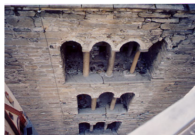
Campanile di S. Orso - Aosta