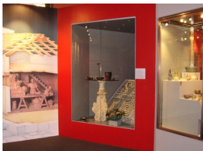
Mostra "ANTICHI SAPORI" – (TO)