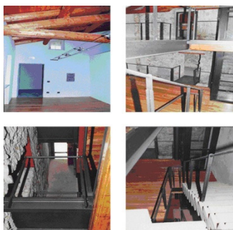
Bussoleno – Casa Aschieri (TO)

Architetto libero professionista, specializzata in restauro e riqualificazione di edifici monumentali, progetta e dirige principalmente opere pubbliche oltre che per committenti privati. Ha partecipato a varie commissioni di studio e collaborato a numerose pubblicazioni, oltre ad aver svolto attività di coordinamento per manifestazioni connesse al XXIII Congresso Mondiale degli Architetti Torino 2008. In collaborazione con il Prof. R. Bedrone ha ideato la prima Guida dei Mestieri Artigiani nell'Architettura ( www.progettogmaa.it ) e il Progetto per la realizzazione di Protec ( www.protec-italia.it ), di cui è coordinatore del tavolo tecnico.