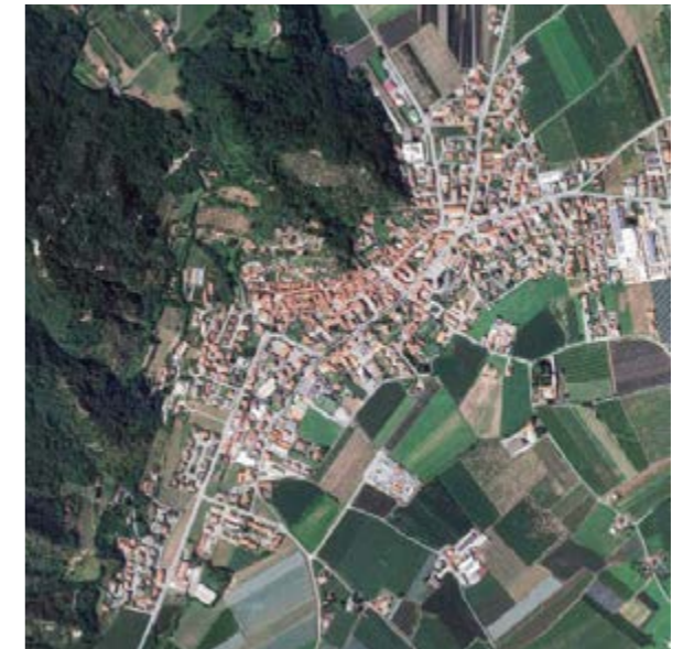
Revello (TO) 4 226 abitanti