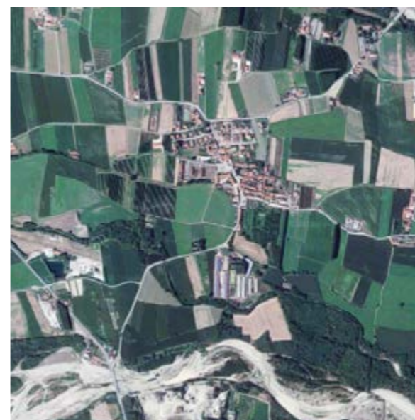
Garzigliana (TO) 556 abitanti