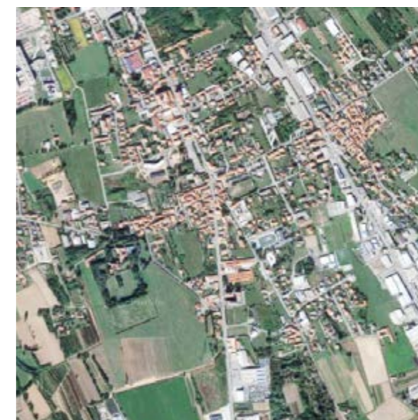
Gaglianico (BI) 3 931 abitanti