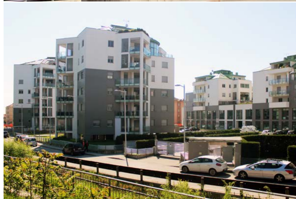
complesso residenziale "Le Torri", Pinerolo (TO)