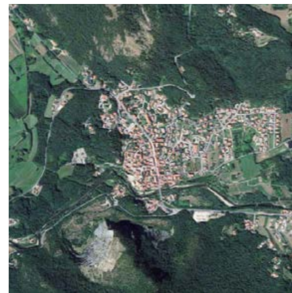
Trana (TO) 3 874 abitanti