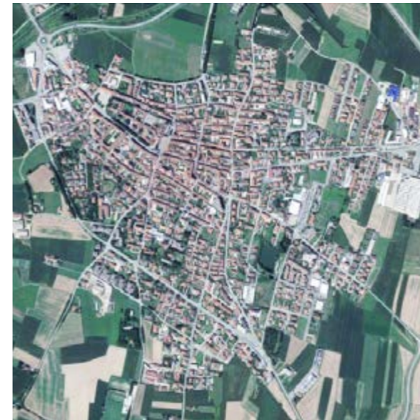
Poirino (TO) 10 245 abitanti