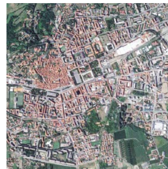
Pinerolo (TO) 35 829 abitanti