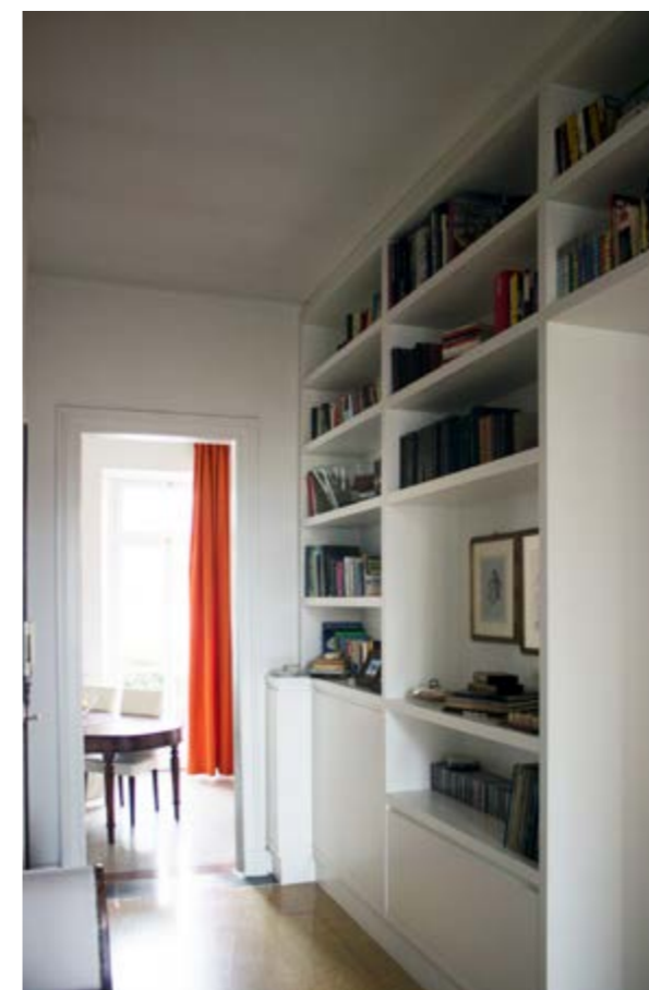
appartamento privato, arredo interno, Torino (TO)