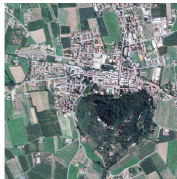
Cavour (TO) 5 642 abitanti