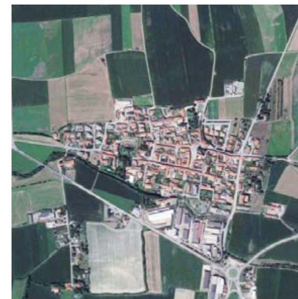
Bibiana (TO) 2 998 abitanti