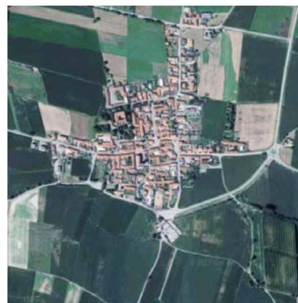
Macello (TO) 1 247 abitanti