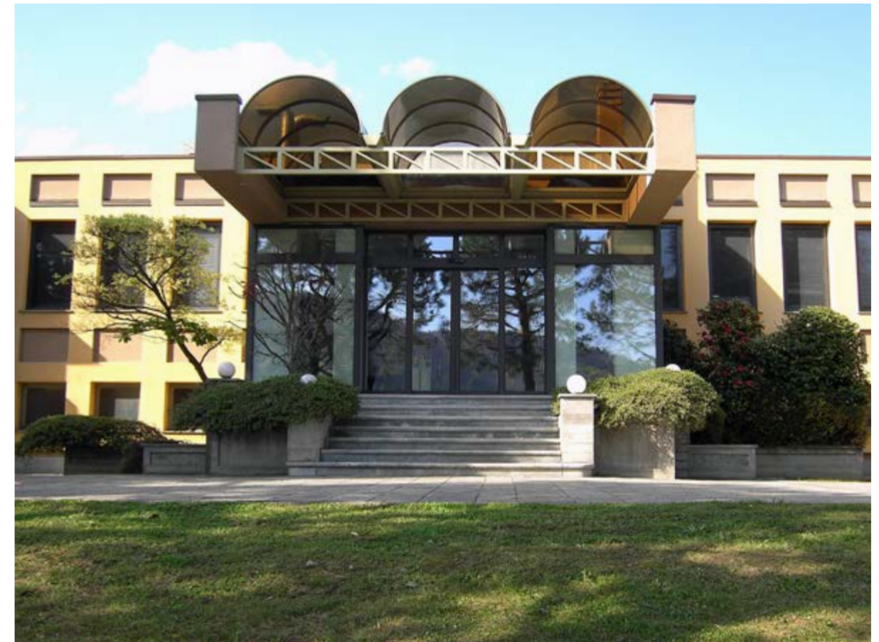
edificio industriale CORCOS, Luserna San Giovanni (TO)