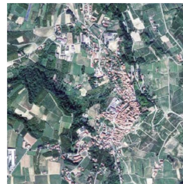
Macello (TO) 1 247 abitanti