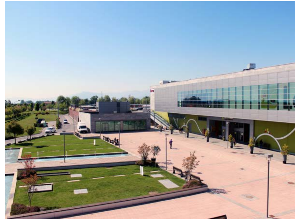
centro commerciale "Le Due Valli", Pinerolo (TO)