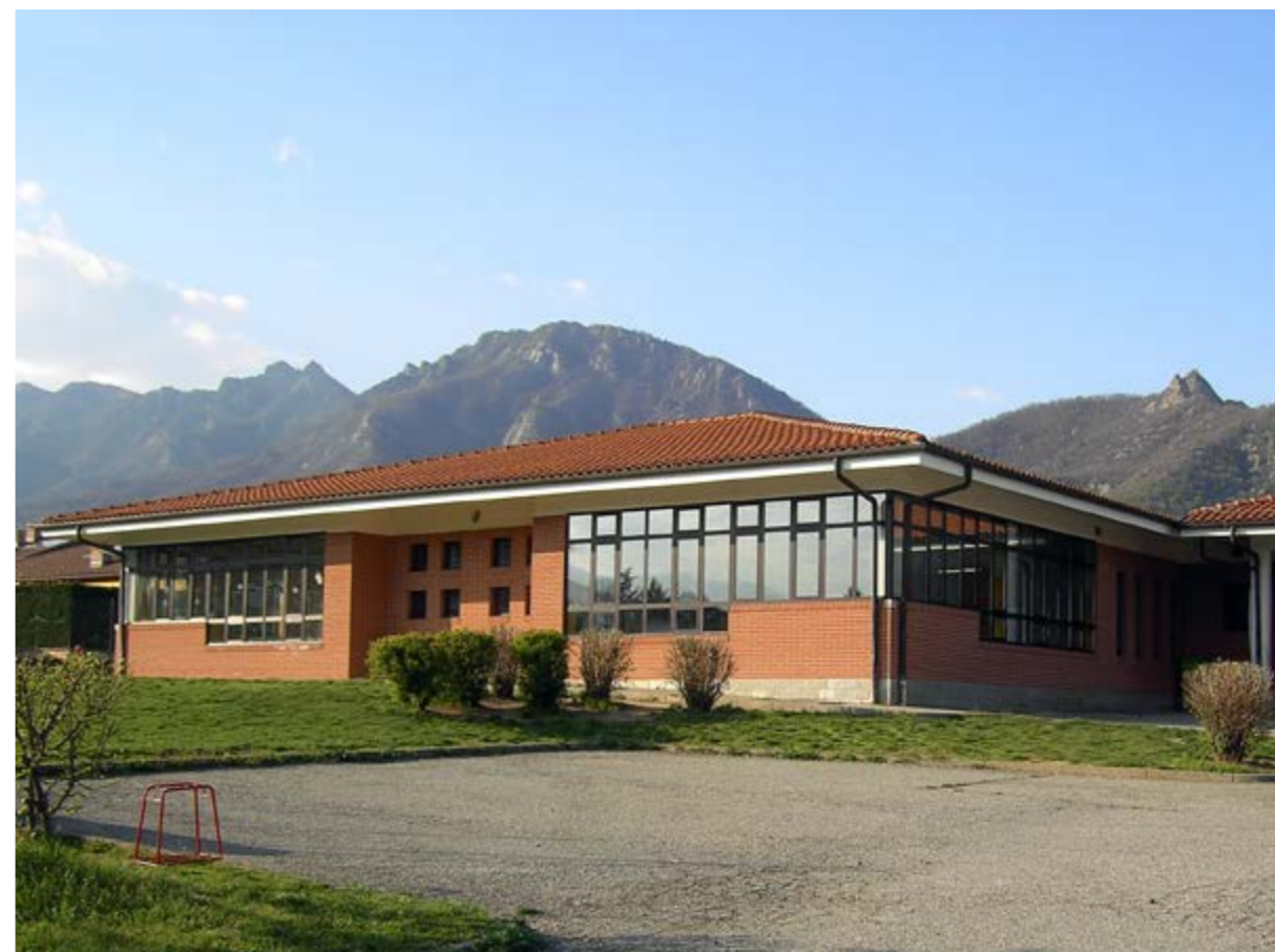
scuola secondaria di primo grado, nuova costruzione, Frossasco (TO)