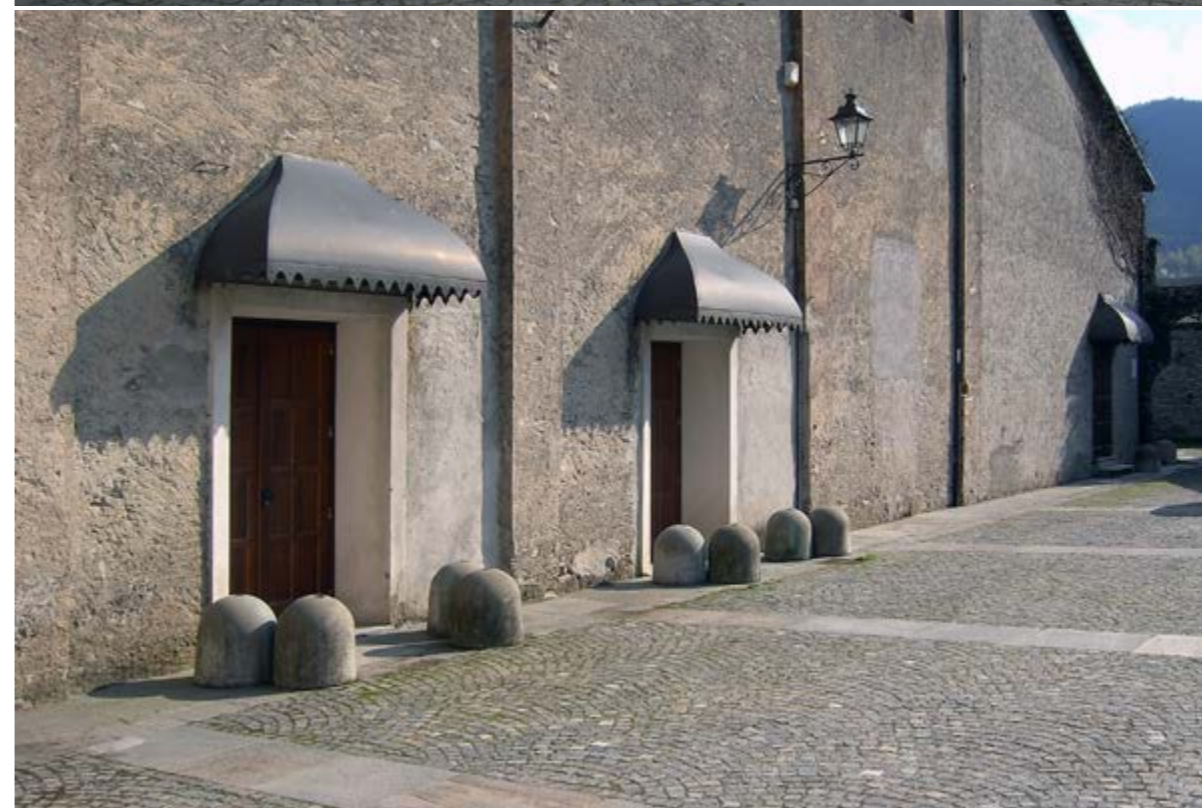
sistemazione del centro storico e recupero del teatro Santa Croce, Luserna San Giovanni (TO)