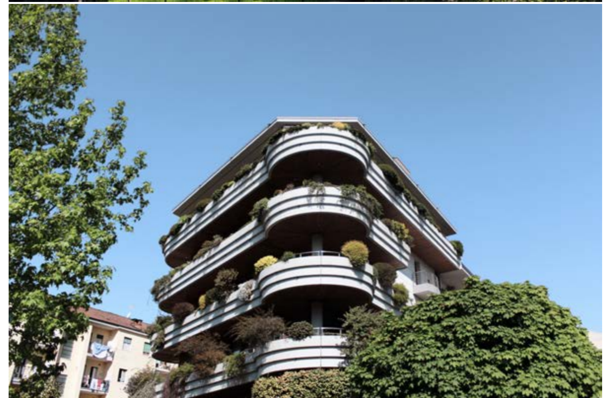
edificio di civile abitazione, nuova costruzione, Pinerolo (TO)