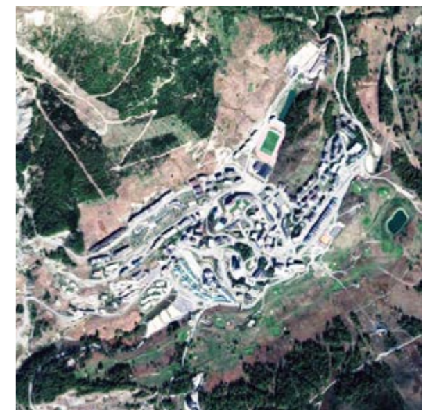
Sestriere (TO) 925 abitanti