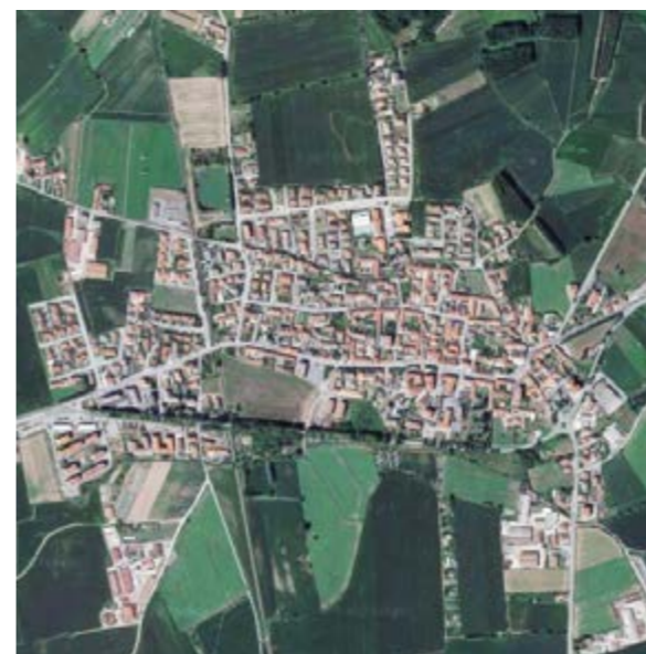
Airasca (TO) 3 842 abitanti