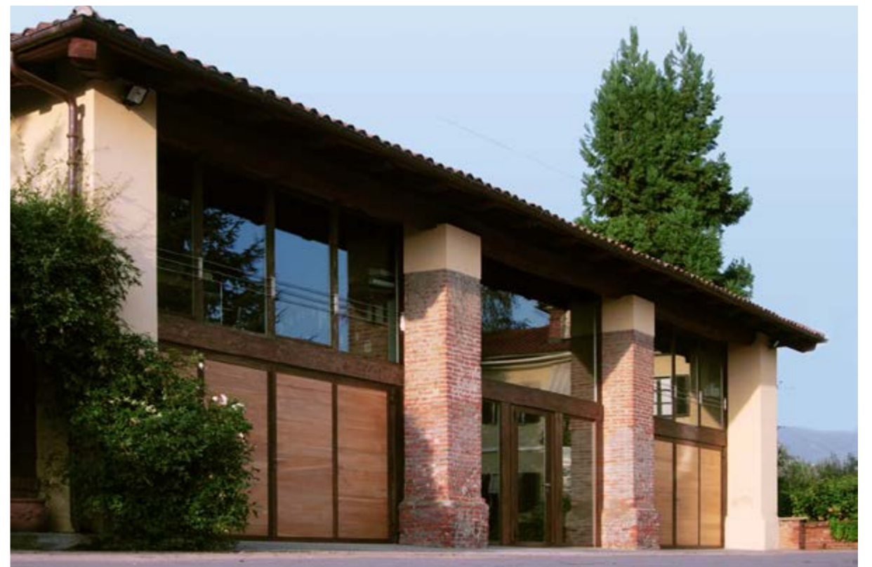
recupero di edificio rurale per uso terziario, Osasco (TO)